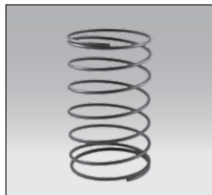
Mat.: Drut sprężynowy Mat.: Spring wire