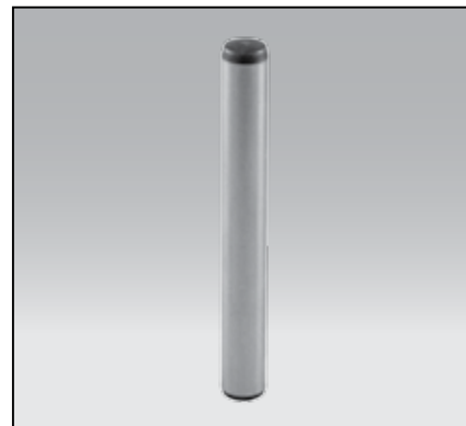
Mat.: Hartowany / Hardened 60±2 HRC